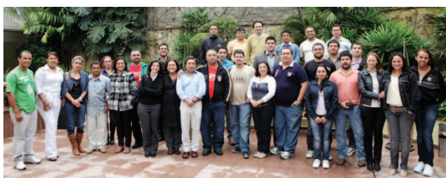
Participantes do encontro dos jovens químicos brasileiros