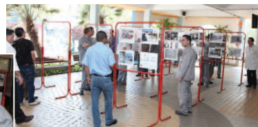
Trabalhadores conferem exposição no pátio da empresa