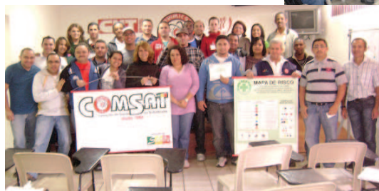
Participantes ao final do curso

e Rotulagem de Produtos Químicos (GHS) e remete para as normas brasileiras regulamentadoras da ABNT (Associação Brasileira de Normas Técnicas).