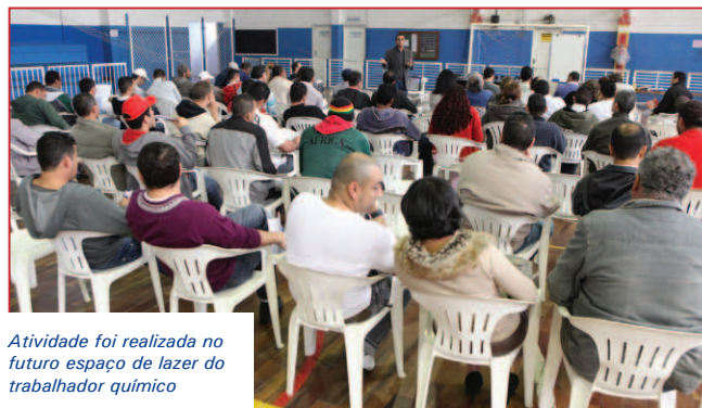
Atividade foi realizada no futuro espaço de lazer do trabalhador químico

A bandeira da redução da jornada ganha destaque devido ao excesso de horas extras nas fábricas e