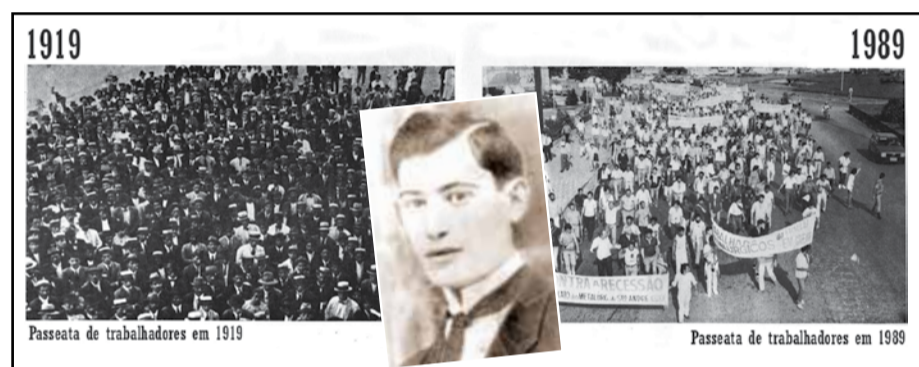
Ilustração do Cartaz de homenagem aos 70 anos da morte de Castellani

O nome da Escola Sindical é uma homenagem ao operário tecelão Constanti Castellani, um dos líderes da União Operária, morto em 1919, aos 18 anos de idade, por policiais quando discursava frente a uma fábrica no município de Santo André, que naquela época chamava São Bernardo.