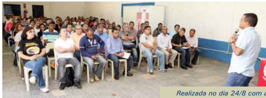
Realizada no dia 24/8 com a diretoria plena e militância, Conferência debateu propostas para a pauta unificada

Seguindo o calendário proposto pela Federação, o Sindicato realizou a Conferência Preparatória da Campanha Reivindicatória 2012, reunindo a diretoria plena mais a militância no dia 24 de agosto, no Cefelqui – Centro de Formação, Esporte e Lazer dos Químicos do ABC.