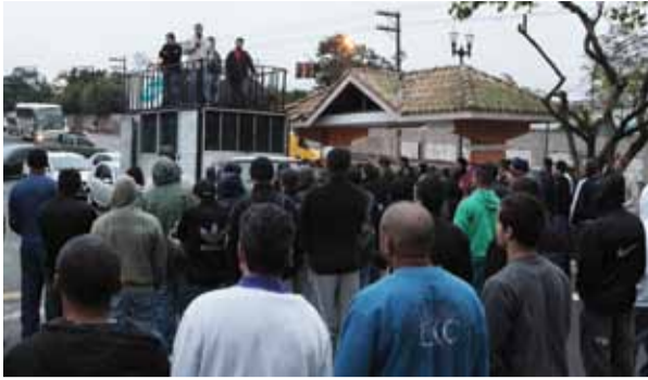
O Sindicato realizou assembleia nos turnos da noite e da manhã (foto), comunicando as 24 horas de luto aos trabalhadores

Os trabalhadores sofreram queimaduras e foram socorridos prontamente pelos seus colegas de trabalho, que prestaram os primeiros socorros e em seguida a ambulância da empresa os encaminhou para o Hospital Ribeirão Pires. Posteriormente, a pedido da empresa, eles foram transferidos para um hospital da capital especializado em queimaduras, e um deles veio a falecer na tarde do dia seguinte, 3 de setembro.