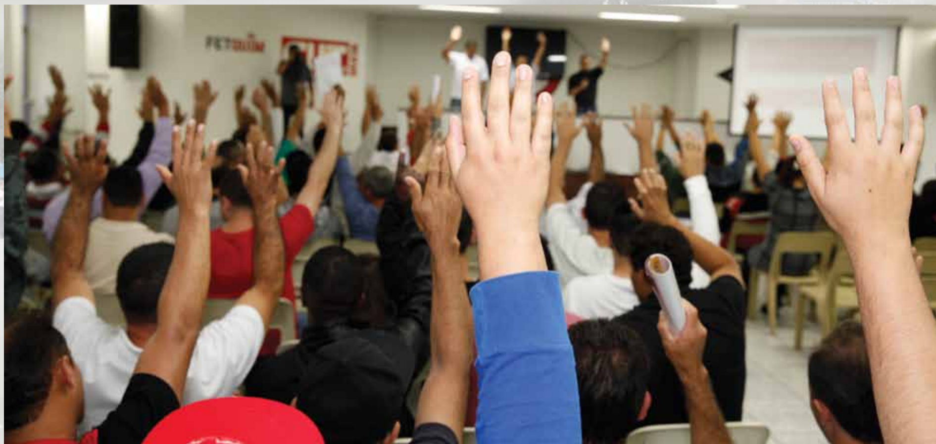
Na assembleia realizada em 8 de novembro, trabalhadores(as) aprovam proposta e autorizam assinatura de acordo com a patronal

A Campanha Salarial 2013 da categoria química do ABC foi, sem dúvida, uma das melhores campanhas salariais dos últimos anos. Além do índice de aumento real entre os melhores conquistados no País este ano, as trabalhadoras e os trabalhadores químicos do ABC conquistaram, com mobilização e luta, MAIS RESPEITO.