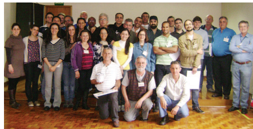
Alunos do curso Realidade Brasileira da UFABC