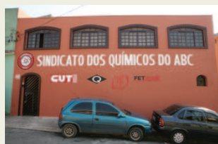
São Bernardo do Campo