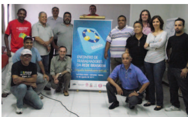
Participantes do Encontro da Rede Braskem

O encontro também estabeleceu pontos comuns para a negociação da próxima Campanha Salarial. Com