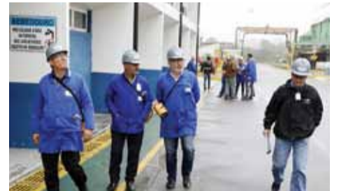
Visita à UNIPAR Carbocloro, em Paranapiacaba