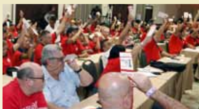
Plenário aprovou sete Moções: Repúdio ao Feminicídio, à política econômica de Bolsonaro/Guedes e apoio à luta do povo chileno foram algumas delas.