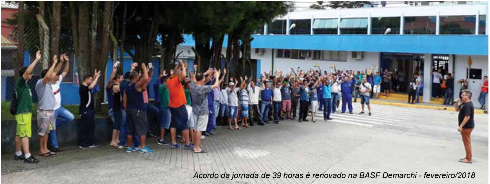
Acordo da jornada de 39 horas é renovado na BASF Demarchi - fevereiro/2018

O anúncio da BASF em migrar do sistema de jornada de trabalho 6x3 para o 6x1, gerou um clima de preocupação nos trabalhadores/as dos setores envolvidos. Logo, Sindicato e Comissão de Fábrica abriram negociação para evitar as demissões que ocorreriam com a redução de uma turma de trabalho.