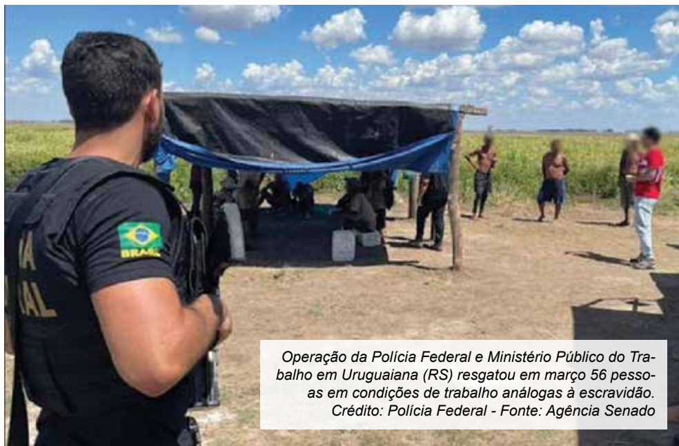
Operação da Polícia Federal e Ministério Público do Trabalho em Uruguaiana (RS) resgatou em março 56 pessoas em condições de trabalho análogas à escravidão.