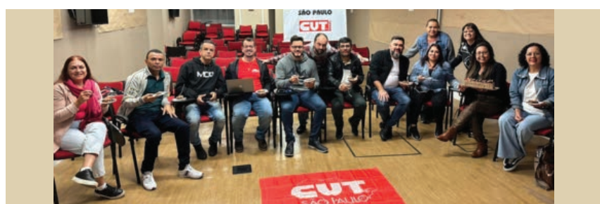
Dirigentes do Sindicato participaram dos 6 módulos de formação da turma FFI (Formação de Formadores Inicial), da Escola Sindical CUT-São Paulo. A diplomação foi realizada no dia 8/08.

cimento econômico e discutir os direitos trabalhistas que foram tirados”, comenta.