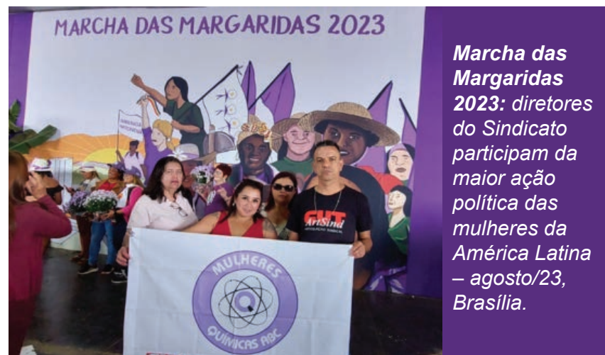
Marcha das Margaridas 2023: diretores do Sindicato participam da maior ação política das mulheres da América Latina – agosto/23, Brasília.